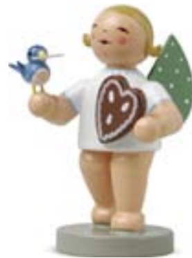
ENGEL MIT LEBKUCHEN UND VOGEL 650/150