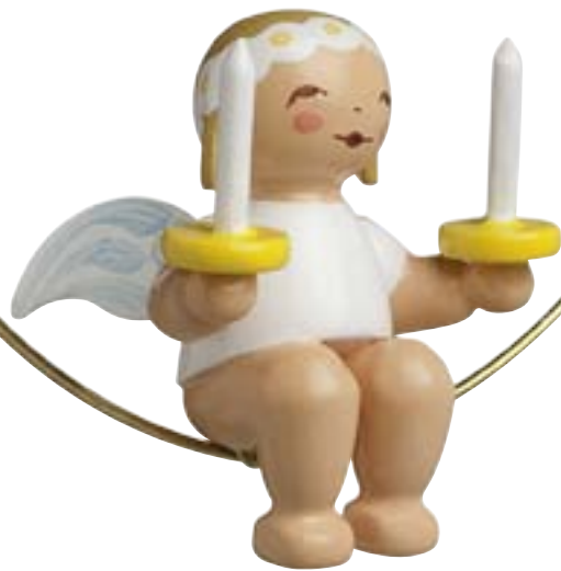
CHRISTBAUMENGEL IM RING, MIT ZWEI KERZEN 6308/20