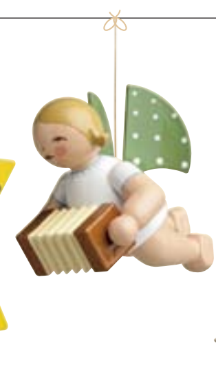
ENGEL MIT HARMONIKA, SCHWEBEND 650/130/8