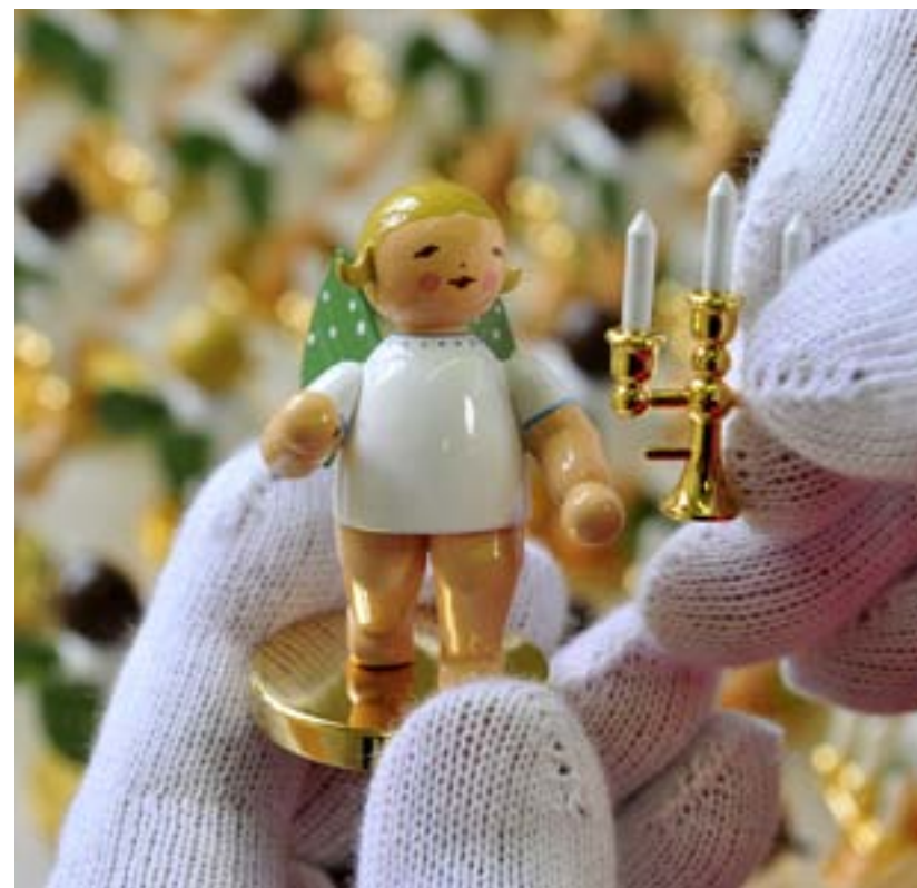
MIT SAMTHANDSCHUHEN werden die Engel der Goldedition bei der Komplettierung angefasst, und auch bei Ihnen zu Hause freuen sich die Gold-Engel über eine sorgsame und pflegliche Behandlung. So bleibt der Glanz dieser exklusiven Meisterstücke lange erhalten.

Wenn Sie diese Tipps beherzigen, werden Sie viele Jahre Freude an Ihrem ganz persönlichen Exemplar der Wendt-&-Kühn-Goldedition haben – so wie Sie es als stolzer Besitzer dieser exklusiven Kreationen aus den Grünhainichener Werkstätten verdient haben.