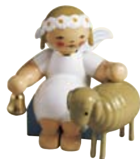
MARGERITENENGEL, SITZEND, MIT LAMM 634170/5