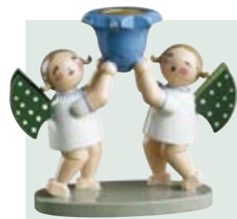
ENGELGRUPPE MIT LICHTNAPF 651/5