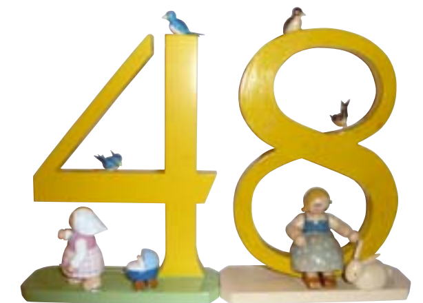
66 JAHRE liegen zwischen diesen beiden Zahlen. Die 8 wurde 1940 gekauft, die 4 im Jahr 2006. 66 Jahre später steht die 4 ihrem älteren Zahlenpartner an Liebreiz in nichts nach.

Haben Sie auch eine schöne Geschichte rund um die Figuren von Wendt & Kühn zu erzählen? Kennen Sie passionierte Sammler oder Liebhaber unserer Figuren, über die wir in der elfpunktepost berichten sollten? Schreiben Sie uns Ihre Geschichte – vielleicht wird sie schon in der nächsten Ausgabe veröffentlicht!