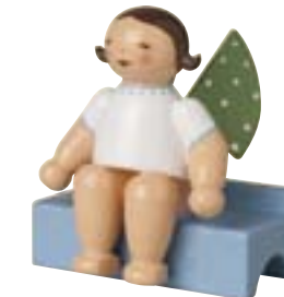
ZUHÖRER, KLEINER ENGEL AUF BANK 650/140/4