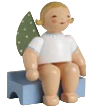
ZUHÖRER, GROSSER ENGEL AUF BANK 650/140/3