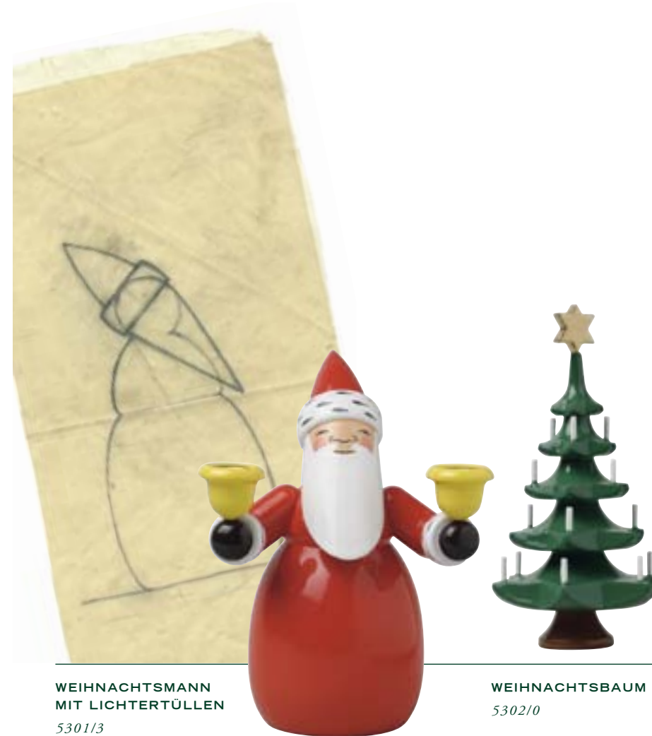
WEIHNACHTSMANN MIT LICHTERTÜLLEN 530/1/3

Die zauberhafte Komposition des Engels mit Lebkuchen und Vogel ergänzt die Reihe der Grünhainichener Engel®, die zu den beliebtesten Sammelobjekten aus der Manufaktur zählen. Das Vögelchen schmückt übrigens auch die berühmte Frühlingsspieldose aus dem Hause Wendt & Kühn, wo es auf dem einzigartigen Laubbaum sein Lied zwitschert.