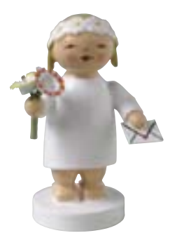
MARGERITENENGEL MIT STRAUSS UND BRIEF 634/60/3

In ihrer kindlichen Unbeschwertheit verströmen die kleinen Figuren einen zauberhaften Charme. Sie sind zart, fast schon filigran, ihre Arme wenige Millimeter lang. Das Gesicht ist mit haarfeinen Strichen gezeichnet. Ihren Namen verdanken sie dem Margeritenkranz, den sie auf ihrem blonden Kopf tragen. Mit etwas Fantasie kann man sich vorstellen, wie sie fröhlich lachend durch blühende Sommerwiesen hüpfen, um sich die Blumen für ihren Kopfschmuck zu pflücken.