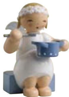
MARGERITENENGEL, SITZEND, MIT KOCHTOPF 634170/17