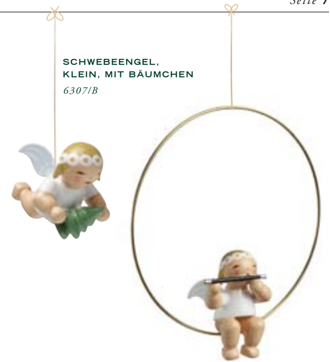
SCHWEBEENGEL, KLEIN, MIT BÄUMCHEN 6307/B