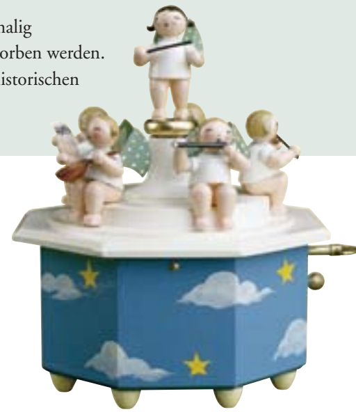
SPIELDOSE ENGELMUSIKANTEN 5336/42A

Die auf dieser Seite abgebildeten Figuren sind vorerst letztmalig gefertigt worden und können bis Ende des Jahres 2011 erworben werden. Anschließend kehren sie für mindestens fünf Jahre in den historischen Musterschrank der Manufaktur zurück.