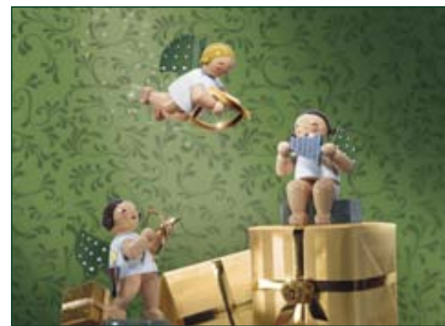
Diese zwei neuen Motive können Sie ab sofort als E-Cards über die Wendt-&Kühn-Website versenden.