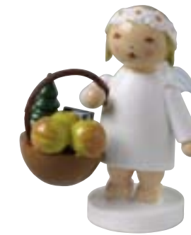
MARGERITENENGEL MIT KORB 634/30/5