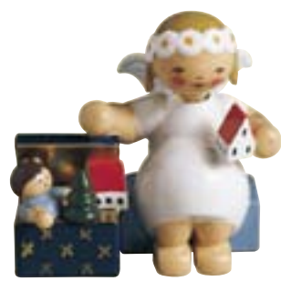
MARGERITENENGEL, SITZEND, MIT SPIELZEUGKISTE 634170/6

DIE SITZENDEN MARGERITENENGEL entwarf Olly Wendt 1935. Zu den ersten Entwürfen der sitzenden Gruppe gehörten der Engel mit Lämmchen sowie der Engel mit Spielzeugtruhe. Inzwischen ist die Schar auf 21 angewachsen.