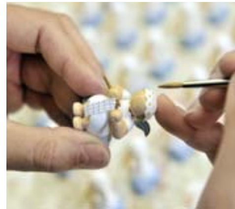
MILLIMETERARBEIT ist es, die winzigen Engel zu bemalen. Mit hauchdünnem, spitzem Pinsel und ruhiger Hand bekommen die Margeriten ihre gelben Blütenpunkte aufgetupft.

In welcher Form die Margeritenengel auch erscheinen – mit ihrem kindlichen Liebreiz verzaubern sie seit über 80 Jahren Sammler