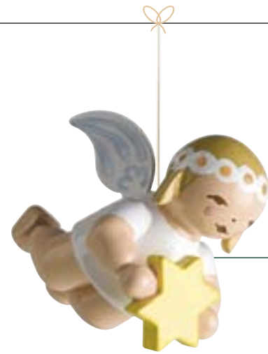
SCHWEBEENGEL, KLEIN, MIT STERN 6307/51