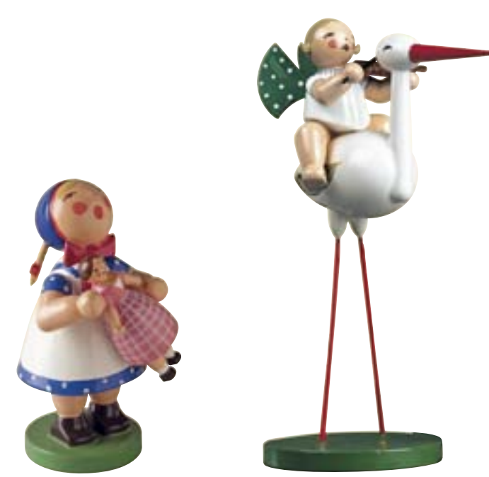
SINGENDES KIND, GROSS 5231/10

73 Jahre später gibt es die Pflegeprodukte immer noch – und auch den Storch mit dem Grünhainichener Engel® und das kleine Mädchen. Als singendes Kind kehrte es in diesem Jahr ins Sortiment der Grünhainichener Werkstätten zurück. Das Original-Muster war 1954 bei einem Brand in der Manufaktur schwer beschädigt worden, wie wir in der Frühjahrsausgabe 2011 der elfpunktepost berichteten. Zum Glück jedoch konnte es aus den Flammen gerettet werden, so dass es nun originalgetreu nach historischem Vorbild wieder aufgelegt werden konnte. Den Storch mit Engel findet man in alten Firmenkatalogen in verschiedensten Positionen: stehend, schreitend, mit hoch erhobenem oder gesenktem Kopf. Auf seinem Rücken reiten Engelmusikanten mit unterschiedlichen Instrumenten. Aktuell befindet sich der Storch mit erhobenem Kopf und Engel mit Geige im Sortiment von Wendt & Kühn.