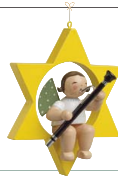
ENGEL MIT FAGOTT, IM STERN 650/70/43