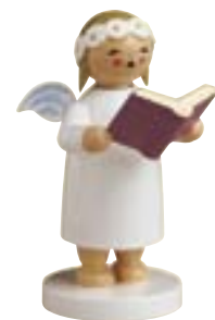
MARGERITENENGEL, GROSS, MIT BUCH 634/21