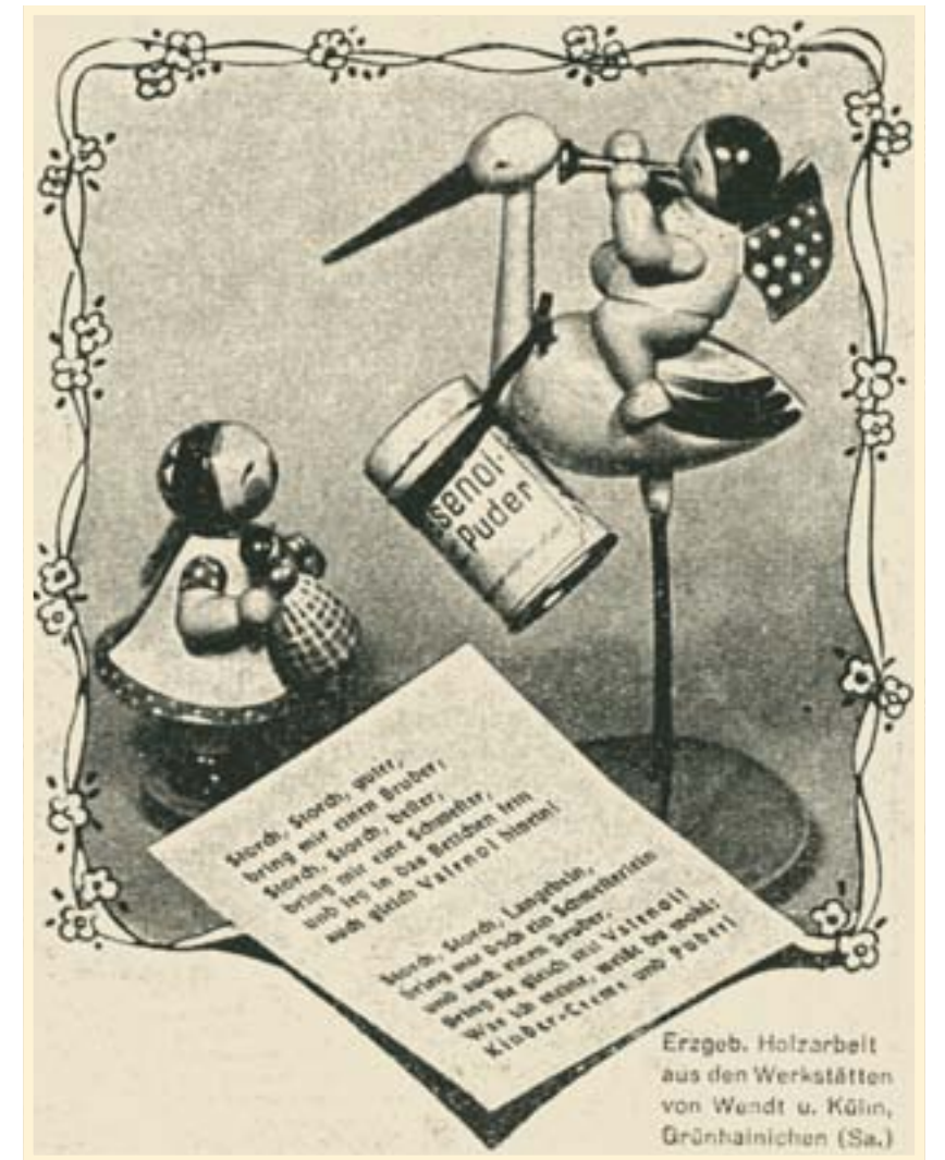
Ergeb. Holzarbeit aus den Werkstätten von Wendt u. Kühn, Grünhainichen (Sa.)

Storch, Storch, guter, bring mir einen Bruder. Storch, Storch, bester, bring mir eine Schwester – mit diesem bekannten Gedicht baut das Kalenderblatt die Brücke zu den Figuren von Wendt & Kühn, die für das Vasenol Kinderpuder werben. Den Mittelpunkt der Gestaltung bildet der grazile Storch aus den Grünhainichener Werkstätten, auf dem ein Engel mit Trompete reitet. Ein kleines Mädchen mit Puppe sieht staunend zu ihm auf – schließlich hat der Storch als passendes Geschenk fürs Brüderchen oder Schwesterchen auch gleich eine Dose Vasenol-Puder mitgebracht – so wie das Kind auf seinem Wunschzettel ihn gebeten hatte: „Und leg in das Bettchen fein auch gleich Vasenol hinein.“