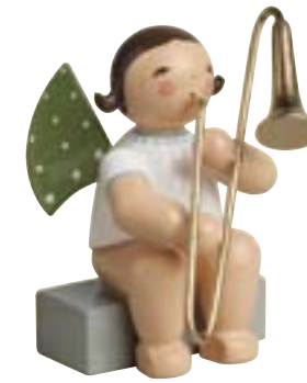
ENGEL MIT ZUGPOSAUNE, SITZEND 650/29a

TISCHKARTENHALTER JUNGE MIT NELKE 5214/17