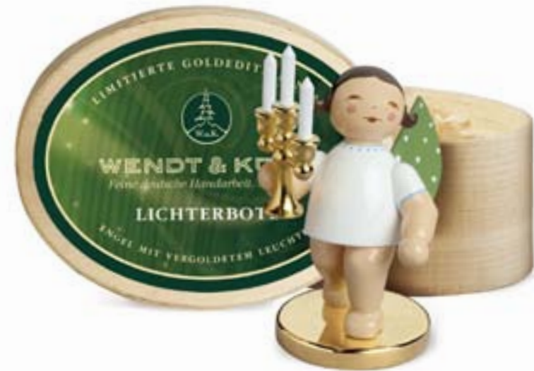
LICHTERBOTE, ENGEL MIT VERGOLDETEM LEUCHTER 650/117/LE