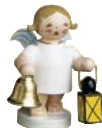
WEIHNACHTSENGEL MIT GLOCKE UND LATERNE 634/40/6