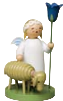
MARGERITENENGEL, GROSS, MIT LAMM & BLUME 634/3N