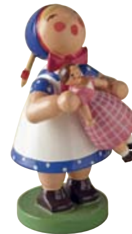
5231/10-11 SINGENDE KINDER