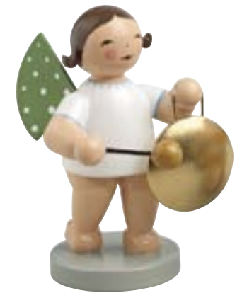
ENGEL MIT GONG 650/71