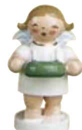
WEIHNACHTSENGEL MIT ADVENTKRANZ 634/40/3