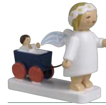
MARGERITENENGEL MIT PUPPENWAGEN 634/30/6

DIE SITZENDEN MARGERITENENGEL entwarf Olly Wendt 1935. Zu den ersten Entwürfen der sitzenden Gruppe gehörten der Engel mit Lämmchen sowie der Engel mit Spielzeugtruhe. Inzwischen ist die Schar auf 21 angewachsen.