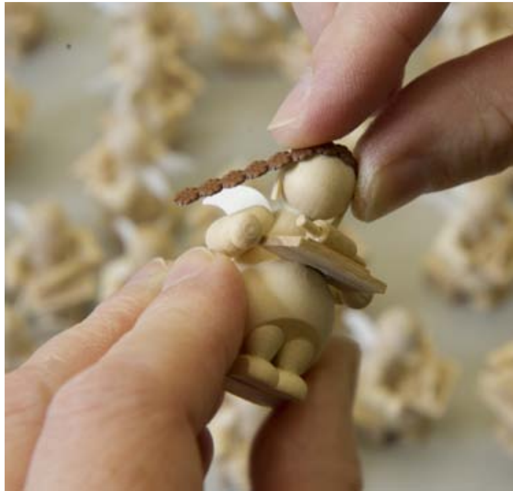
DER BLÜTENKLANZ verlieh den Margeritenengeln ihren Namen. Was man nach der Bemalung nicht mehr vermutet: Der filigrane Kranz besteht aus Pappe, die mit der Blütenprägung versehen wird. Ursprünglich war die Blütenborte aus Zinn. Um das Jahr 1940 wurde wegen Rohstoffknappheit auf Pappe umgestellt – und so ist es bis heute geblieben.

Sammlerobjekten: Sie backen und stricken, sie basteln und kleben, sie hämmern und klopfen, sie malen und spielen. Als emsige Helfer des Weihnachtsmannes sind sie inzwischen unentbehrlich – und in jedem Jahr werden es mehr. Der Margeritenkranz übrigens wird auf fast schon museumsreifen Maschinen in der Werkstatt von Otto Mäckel im sächsischen Burgstädt geprägt.