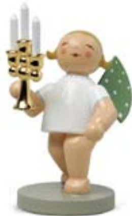
Goldedition No4 LICHTERBOTE, ENGEL MIT VERGOLDETEM LEUCHTER 650/117

In jeder Saison kehrt eine Handvoll Entwürfe aus dem großen Musterschrank zurück ins Sortiment der Manufaktur. Hier lernen Sie die Heimkehrer dieses Herbstes kennen.