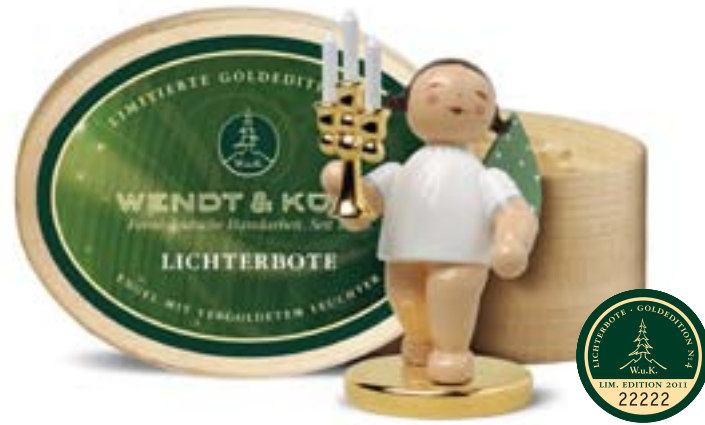
Limitierte Goldedition No4 LICHTERBOTE, ENGEL MIT VERGOLDETEM LEUCHTER UND VERGOLDETEM METALLSOCKEL IN SPANSCHACHEL 650/117/LE