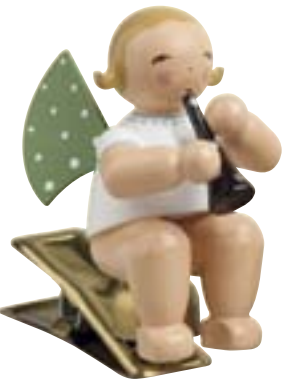
ENGEL MIT KLARINETTE, AUF KLEMME 650/90/41