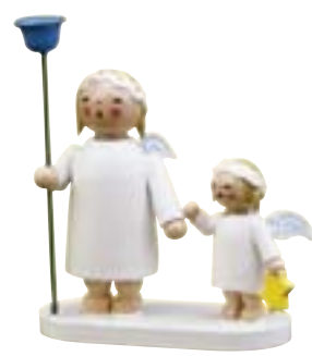
ENGELGESCHWISTERPAAR MIT NAPF & STERN 634/9