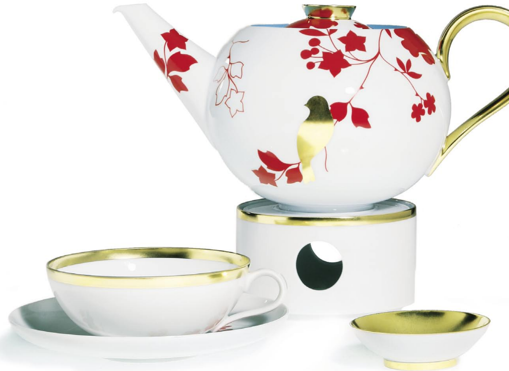
TREASURE GOLD & EMPEROR'S GARDEN

With Treasure Gold, a fourth decorative set graces the innovative system of shapes and sizes of MY CHINA! This youngest, but also most classical, variation provides unique combinational opportunities. Depending on your taste, the table arrangement can glisten in pure white gold or be interspersed with fresh platinum highlights from MY CHINA! Treasure. A touch of colour is introduced with Emperor's Garden. Quoting Chinese porcelain paintings, this pattern shows motifs in red, blue and gold. Calm, illustrious breaks are set by simple white. MY CHINA! has removed almost all bounds to individual self-expression. Welcome to contemporary tableware. With MY CHINA! and Treasure Gold, a true classic in a modern style.